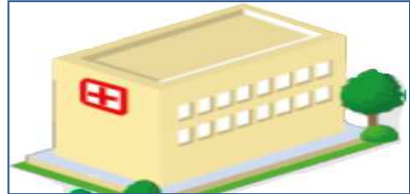
Farmácia – FE da Regional de Saúde