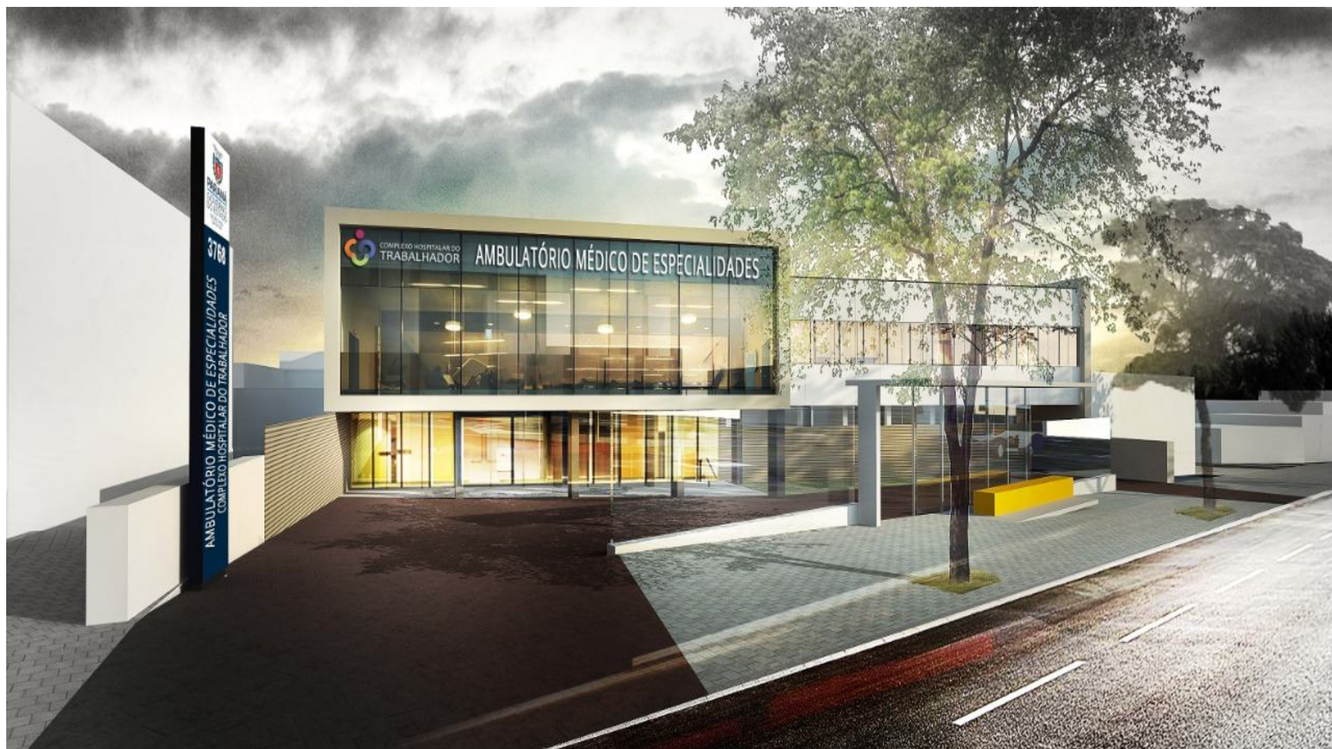
AME – Ambulatório Médico de Especialidades